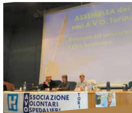
ARIA n.12 anno IV - giugno 2015 - pag 4

Da parte dei volontari e della Redazione di ARIA un sentito ringraziamento ai Consigli uscenti per il lavoro svolto e un grosso augurio ai nuovi. Senza dimenticare l'amorevole attività svolta quotidianamente da tutti i volontari!