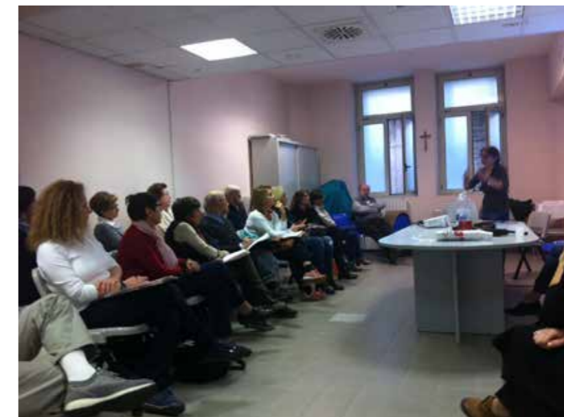
ARIA n.14 anno V - febbraio 2016 - pag 3

Sabato 3 ottobre ha preso il via con successo il Corso per la formazione di futuri colleghi volontari. Le adesioni sono state numerose, rappresentate da