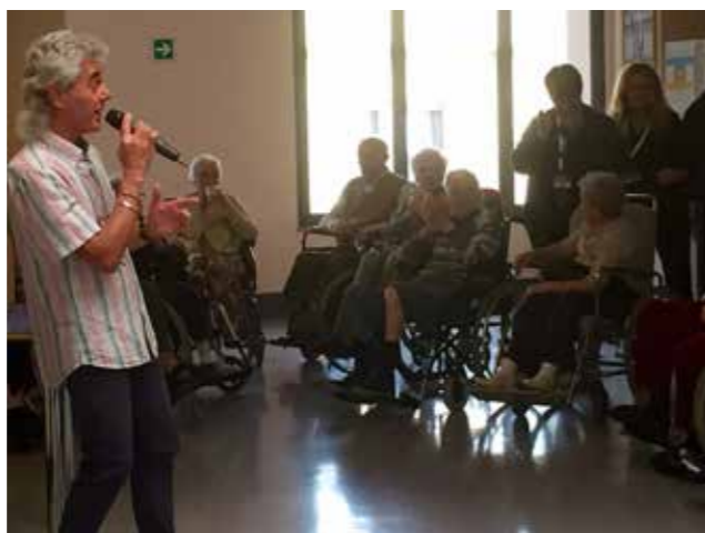
ARIA n.14 anno V - febbraio 2016 - pag 2

Toccante e ricco di significati il rito religioso della celebrazione della Santa Messa, il sabato, che dà a questo momento di unione tra ospiti, parenti, e noi volontari, il sapore della normalità, di un gesto abituale della vita